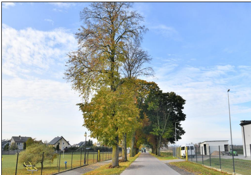
Fragment alei przydrożnej przy drodze 1250N – Mroczno, w kierunku na zachód.

Wartości naukowe: jako dokument minionej epoki może stanowić przedmiot badań naukowych.