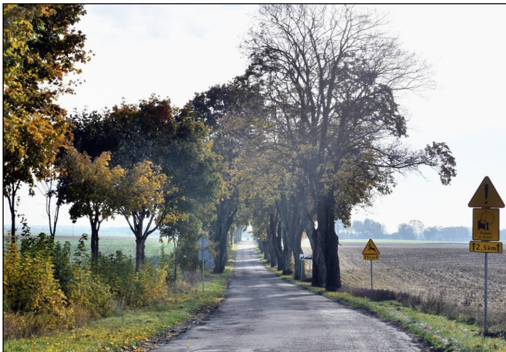
Fragment alei przydrożnej przy drodze 1335N – Mroczo, w kierunku na południe.

Wartości naukowe: jako dokument minionej epoki może stanowić przedmiot badań naukowych.