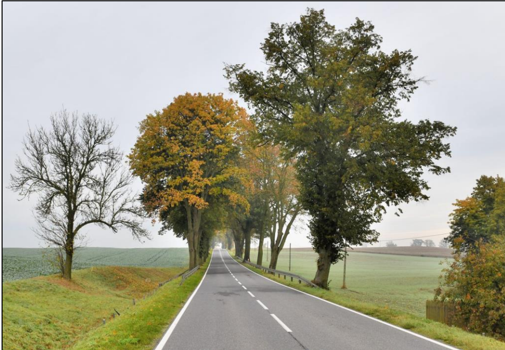
Fragment alei przydrożnej przy drodze 541N – ob. Ostaszewo widok na północ

Wartości naukowe: jako dokument minionej epoki może stanowić przedmiot badań naukowych.